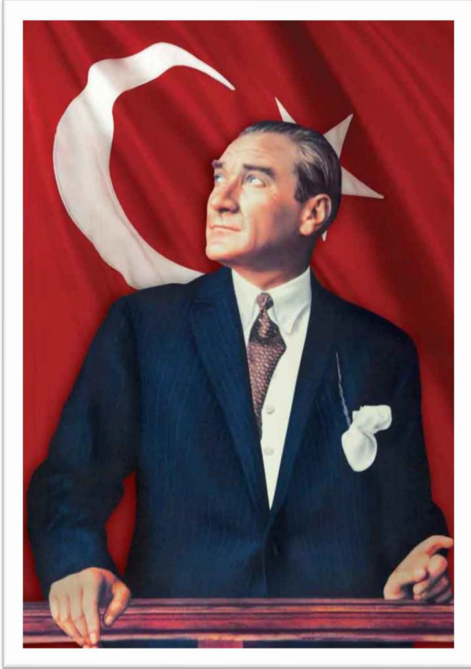
Gazi Mustafa Kemal ATATÜRK