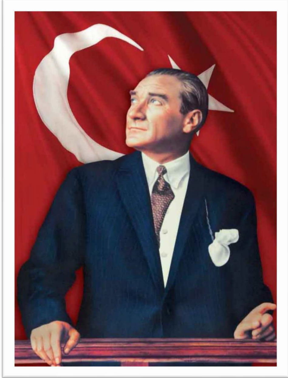
Gazi Mustafa Kemal ATATÜRK