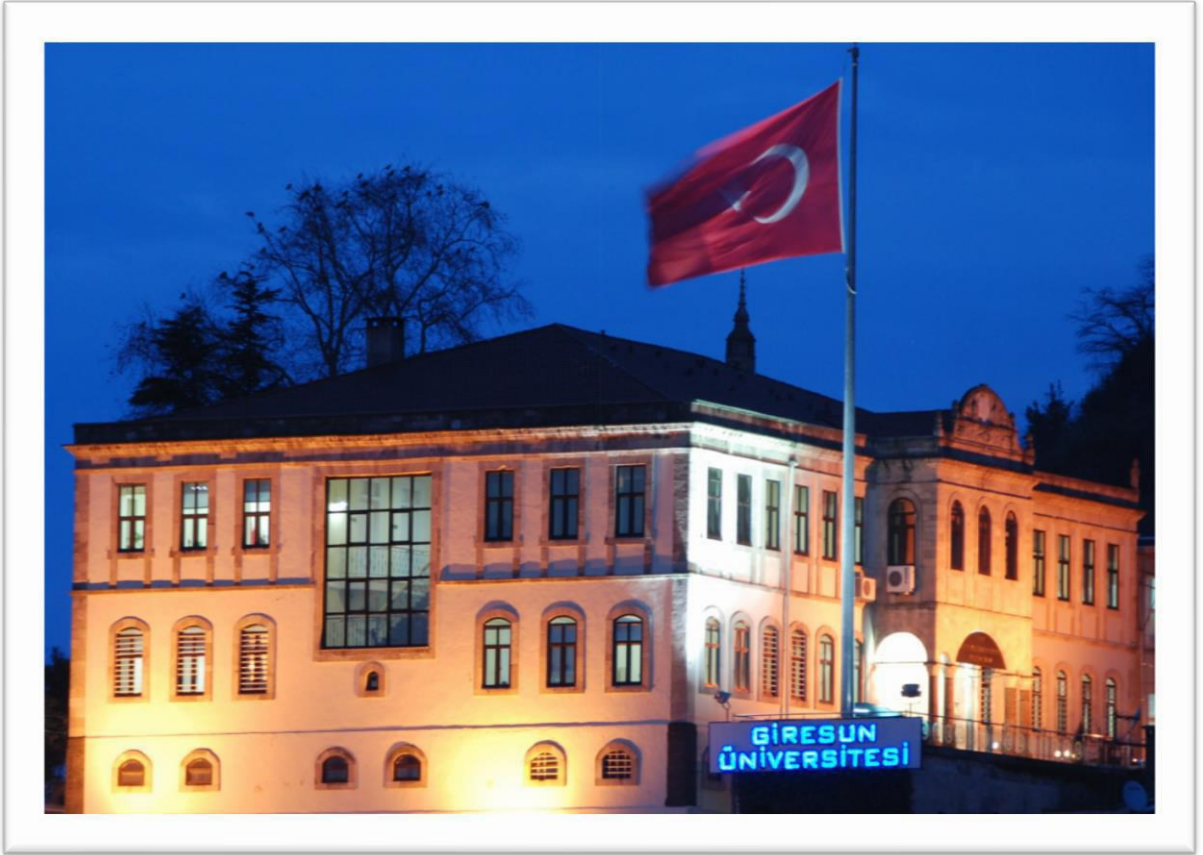
Rektörlük Merkez Binası